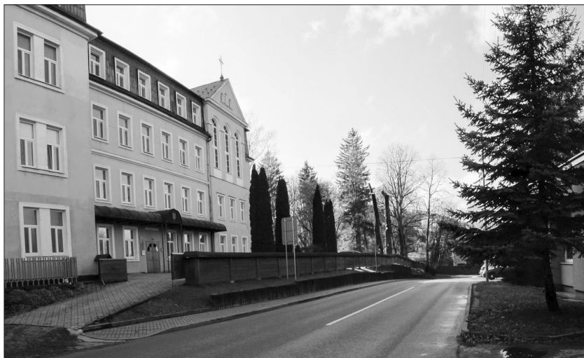
Budova noviciátu Spoločnosti Ježišovej v Ružomberku