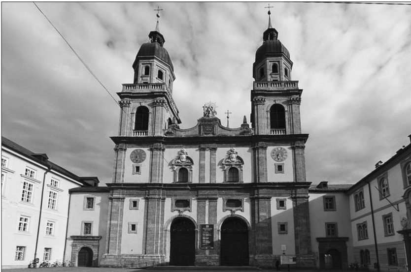
Kostol Najsvätejšej Trojice v Innsbrucku

Na zozname badať pestrosť vtedajšieho seminárneho života. Medzi vysvätenými figurovali zástupcovia diecéz na území strednej Európy (Nitra, Brixen, Čanády), Dánskeho apoštolského vikariátu, ale aj početná skupina bohoslovcov z amerických diecéz (Chicago, Cincinnati, Toledo, Dubuque).