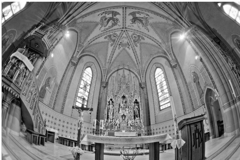
Intriér Kostola Ružencovej Panny Márie v Černovec

Hlinkovi v tom istom liste píše, ako si do Kaloče po súhlase tamjšieho rektora zadovážili knihy v materinskej reči: „O krátky čas prišiel balík z Martina, zaopatrili sme si básnikov, prozaistov i Šrobárovu Zdravovedu, i Váš proces... a podobné. [...] Ako že sa majú naši? Myslím, budú zdraví. [...] Nech Vás Božské Srdce všetkých požehná; odporúčam sa do Vašich bohumilých modlitieb.“