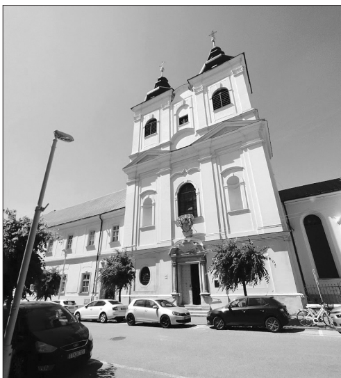
Jezuitský kostol a kláštor v Trnave