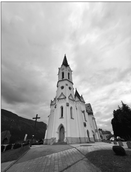
Kostol Ružencovej Panny Márie v Černovej